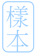
【附表一：本契約收取之相關費用一覽表】